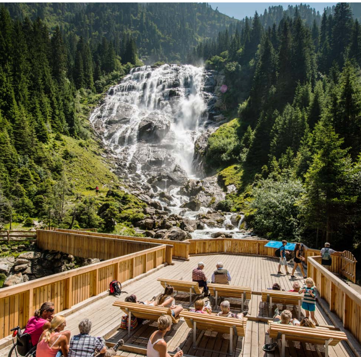
Die barrierefrei zugängliche Plattform am Grawa Wasserfall.

Der WildeWasserWeg lädt seine Begeher ein, das vergletscherte Hochtal wie ein aufgeschlagenes Buch zu betrachten, aus dem die Landschaft formende Kraft des Wassers heraus zu lesen ist. Eine spannende Geschichte voller dramatischer Ereignisse.