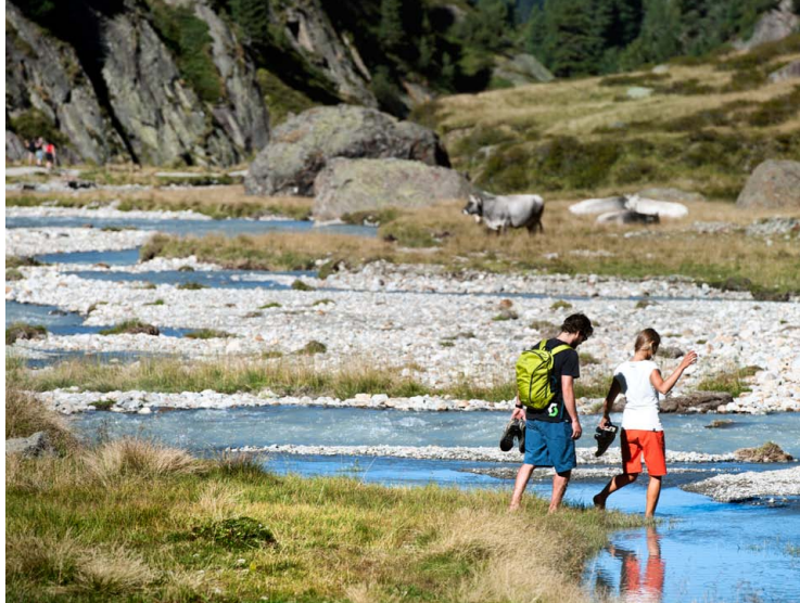
Wandern am Stubaier WildeWasserWeg: Bewegung und Wohlbefinden